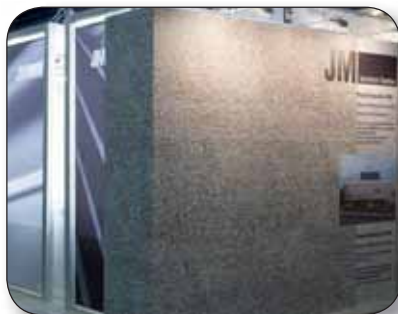
JM TEXTILES - Op wand gespannen doek