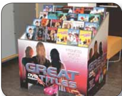
RE-BOARD - Dvd-meubel