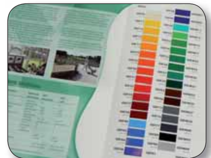
GRAFITYP GEF - Levendige kleuren