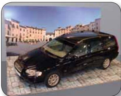
RE-BOARD - Beursstand

Vrij van ftalaten Gegarandeerd vrij van chloorhoudende gifstoffen