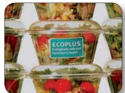
JAC ECOPLUS - Screen vinyl