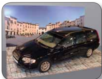
RE-BOARD - Stand foire

Sans phtalate Garanti sans dérivés chlorés toxiques