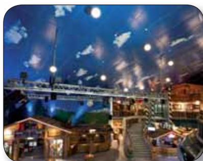
JM TEXTILES - Dalles de plafond