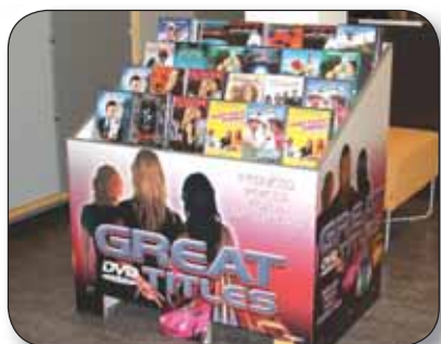
RE-BOARD - Meuble DVD