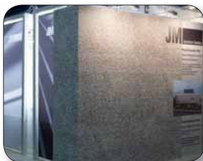
JM TEXTILES - Cloison toile tendue