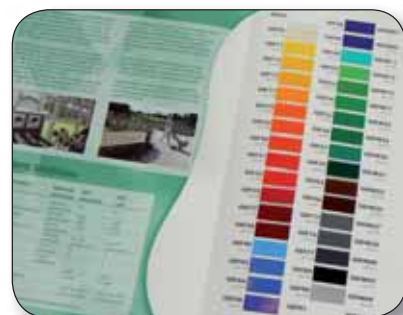
GRAFITYP GEF - Couleurs vives