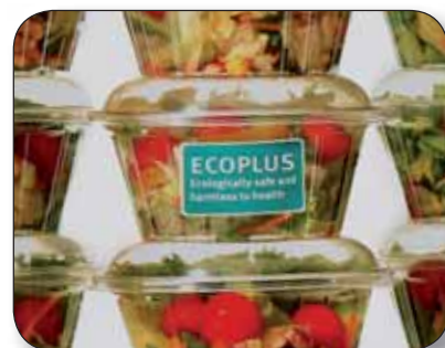
JAC ECOPLUS - vinyle screen